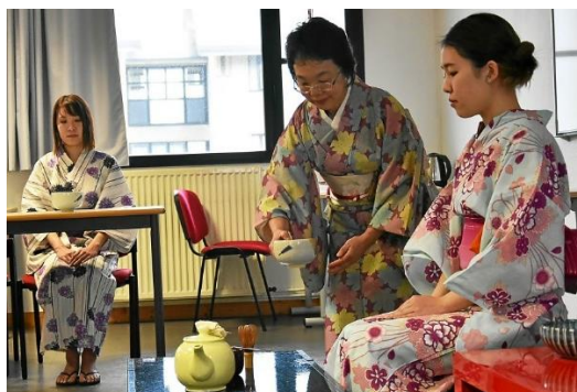
▲ La cérémonie traditionnelle du thé